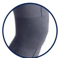
Funktionszone Knie / Ellenbogen