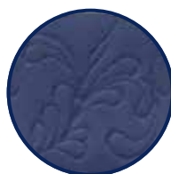
Bund mit Blumenmotiv (5 cm)