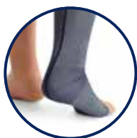
Funktionszone Fuss, T-Ferse