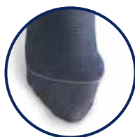
Hallux Valgus Zone (offen/ geschlossen)